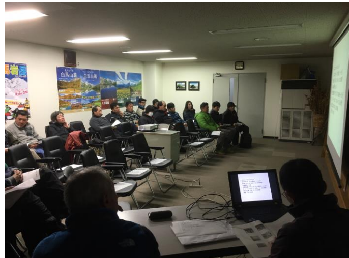
グループ会社での技術管理者研修報告会に参加