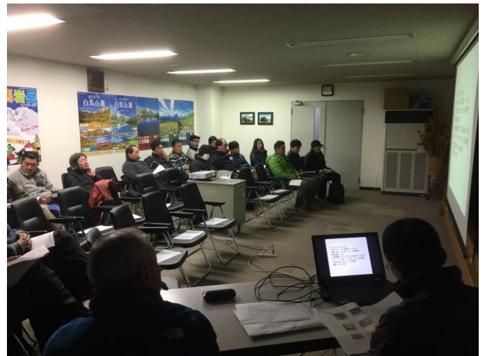
グループ会社での技術管理者研修報告会に参加

索道安全運行マニュアルを作成し新人研修および、シーズン開始時に安全運行に関する研修・救助訓練を実施しています。研修は経験者、未経験者に関係なく、スタッフ全員が研修を受けられるよう数回に分けて実施し、研修は安全運行マニュアルの修得及び救助訓練に加え、サービス研修や様々な事故事例をもとにした、トラブル対応などを含めた内容にて実施しています。また、シーズン中においても定期的なミーティングを行うとともに、トラブルやヒヤリ・ハット事例を常時収集・共有し対策を講じています。また、他スキー場も含めた事故・トラブル事例も速やかに水平展開し注意喚起と安全向上に努めています。