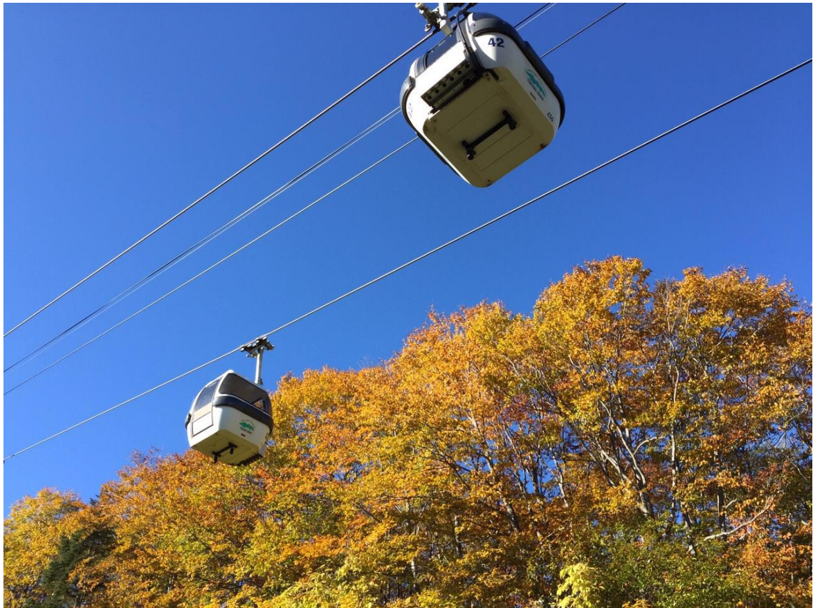
柵池ゴンドラリフト