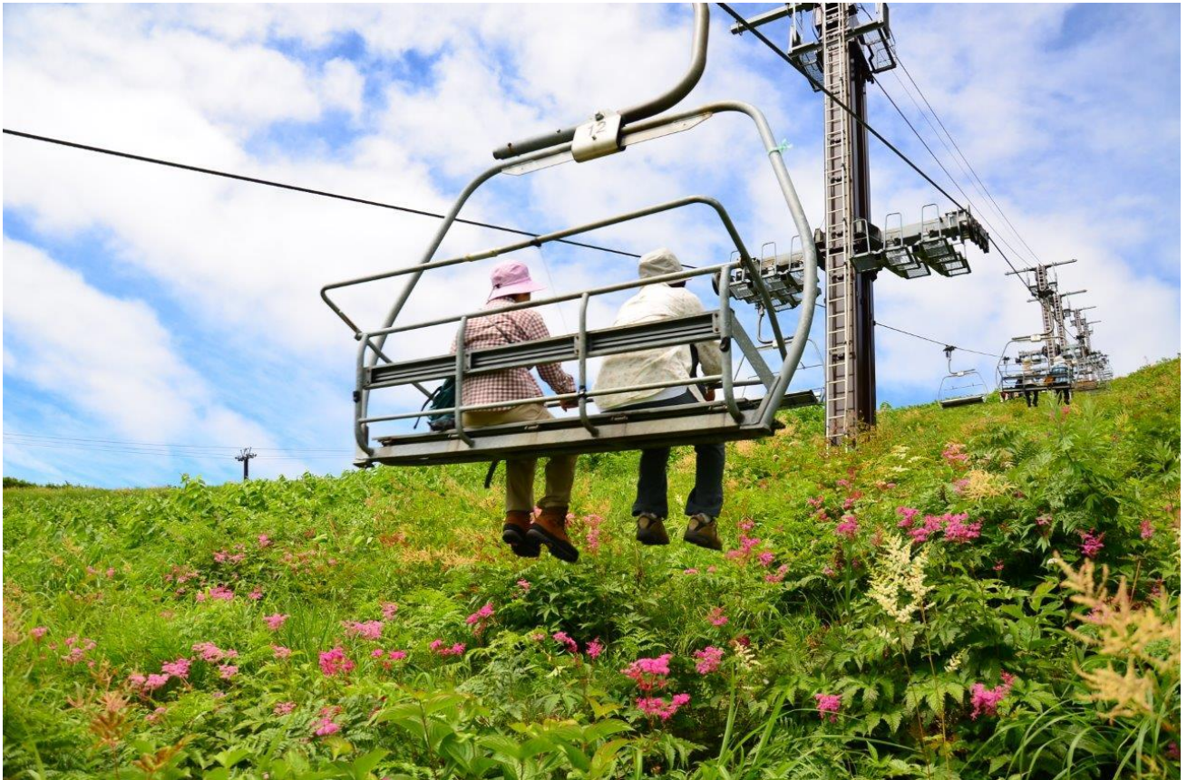
アルペンクワッドリフト