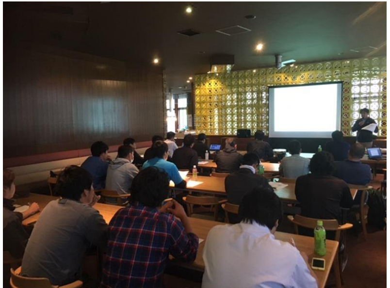
日本スキー場開発(株)グループ会社合同研修会

また、シーズン中においても定期的なミーティングを行うとともに、トラブルやヒヤリ・ハット事例を常時収集・共有し対策を講じています。また、他スキー場も含めた事故・トラブル事例も速やかに水平展開し注意喚起と安全向上に努めています。