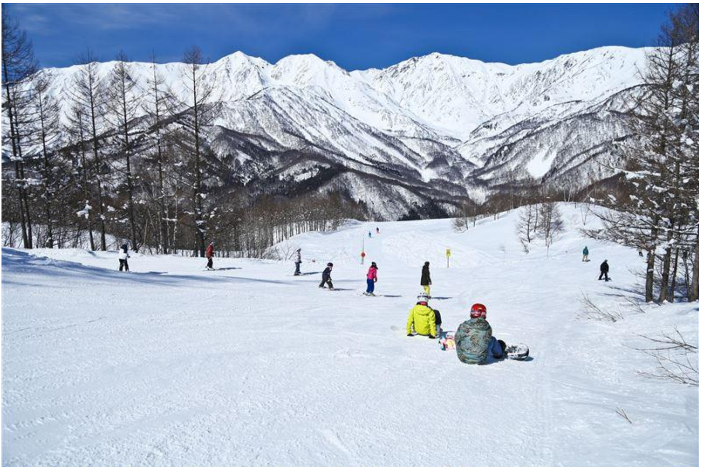
岩岳ビューゲレンデ