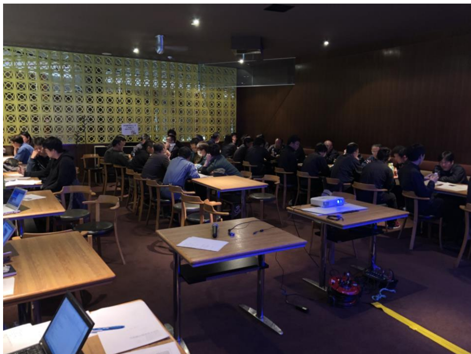
日本スキー場開発(株)グループ会社合同研修会

索道安全運行マニュアルを作成し新人研修および、シーズン開始時に安全運行に関する研修・救助訓練を実施しています。研修は経験者、未経験者に関係なく、スタッフ全員が研修を受けられるよう数回に分けて実施し、研修は安全運行マニュアルの修得及び救助訓練に加え、サービス研修や過去の事故事例をもとにした、トラブル対応などを含めた内容にて実施しています。また、シーズン中においても定期的なミーティングを行うとともに、トラブルやヒヤリ・ハット事例を常時収集・共有し対策を講じています。また、他スキー場も含めた事故・トラブル事例も速やかに共有し注意喚起と安全向上に努めています。