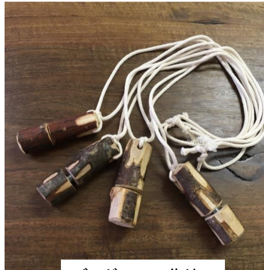
バードコール作り