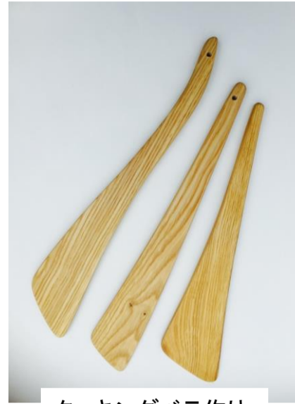
クッキングペラ作り