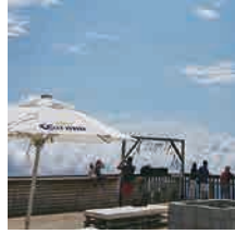
白馬村を見下ろし、遠方の浅間山まで見渡せる「Corona Escape Terrace」