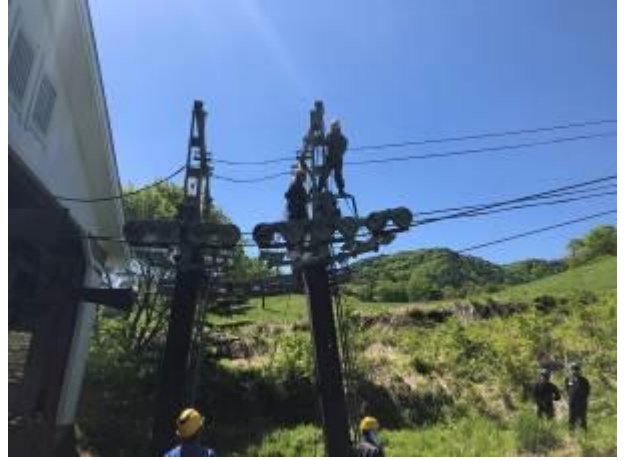
日本スキー場開発(株)グループ会社合同研修会

また、シーズン中においても定期的なミーティングを行うとともに、トラブルやヒヤリ・ハット事例を常時収集・共有し対策を講じています。また、他スキー場も含めた事故・トラブル事例も速やかに共有し注意喚起と安全向上に努めています。