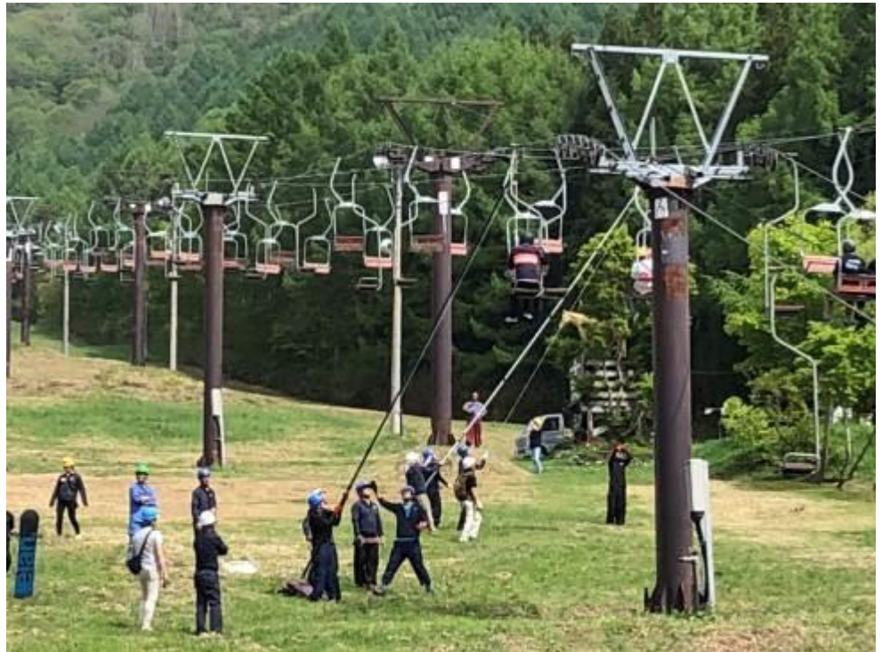
日本スキー場開発(株)グループ会社大規模災害救助訓練

日本スキー場開発(株)グループ会社合同で定期的にミーティングを行い、事故・トラブル、ヒヤリ・ハットについて、他事業者を含む事例の分析や対策、技術情報の共有を行うとともに、グループ会社相互で内部監査を行い、安全性の更なる向上に努めております。また、春にはBCP（事業継続計画）により緊急事態を想定した訓練を行い、秋には合同研修会にて、グループ全体での技術の向上、各社安全対策についての報告会を行い、安全な索道輸送の取組みを継続しております。