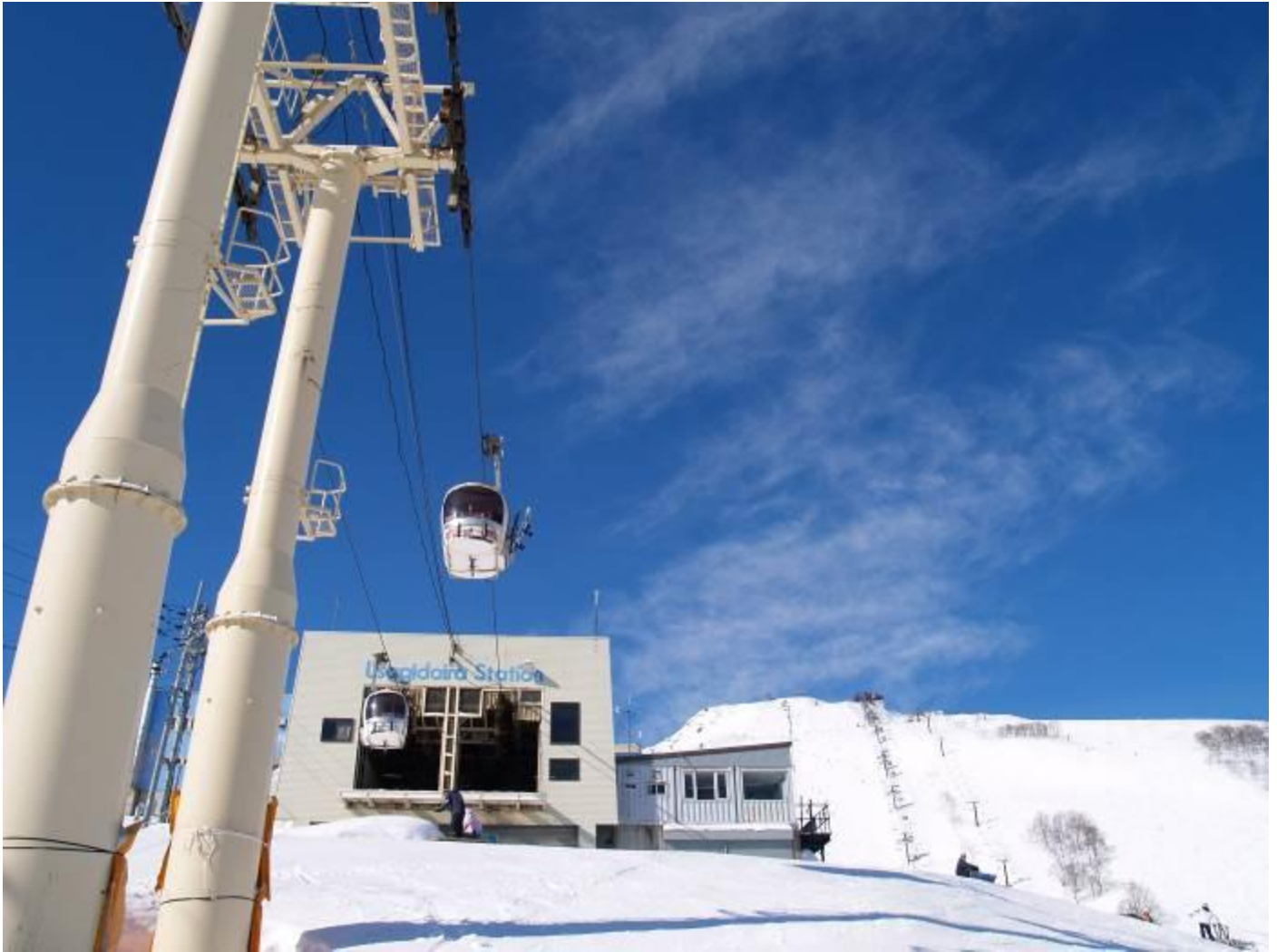
八方尾根ゴンドラリフト