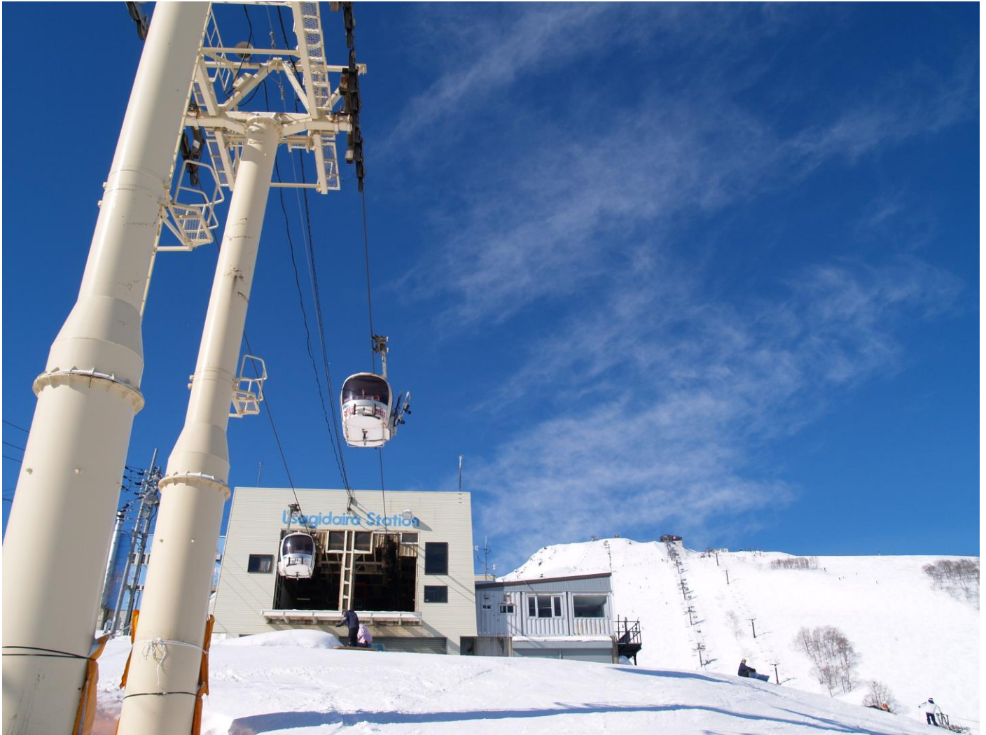
八方尾根ゴンドラリフト