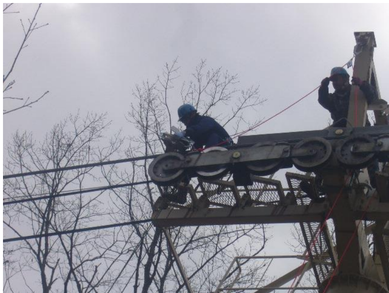
索道スタッフによる救助訓練

また、シーズン中においても定期的なミーティングを行うとともに、トラブルやヒヤリ・ハット事例を常時収集・共有し対策を講じています。また、他スキー場も含めた事故・トラブル事例も速やかに共有し注意喚起と安全向上に努めています。