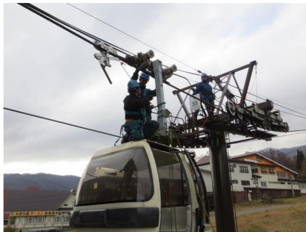
梅池ゴンドラ救助訓練

また、シーズン中においても定期的なミーティングを行うとともに、トラブルやヒヤリ・ハット事例を常時収集・共有し対策を講じています。また、他スキー場も含めた事故・トラブル事例も速やかに共有し注意喚起と安全向上に努めています。