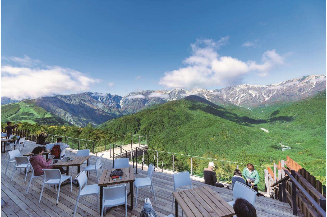
岩岳スノーフィールド マウンテンハーバー