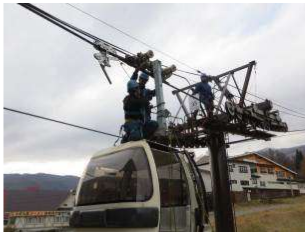
梅池ゴンドラ救助訓練

また、シーズン中においても定期的なミーティングを行うとともに、トラブルやヒヤリ・ハット事例を常時収集・共有し対策を講じています。また、他スキー場も含めた事故・トラブル事例も速やかに共有し注意喚起と安全向上に努めています。