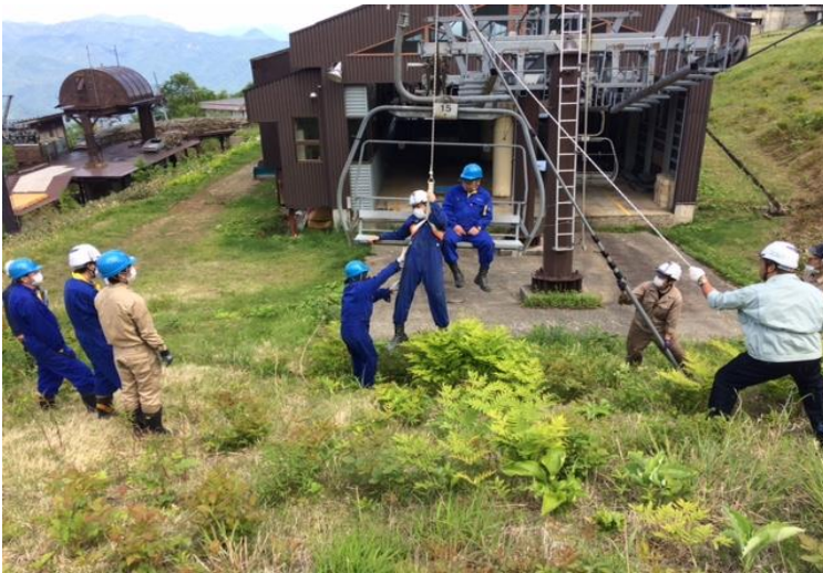
「全職場参加救助訓練」