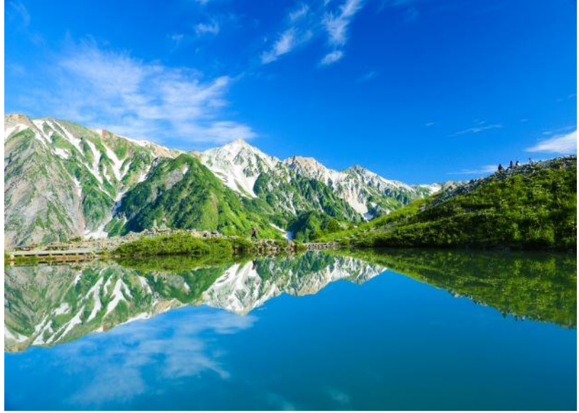
「山岳景勝地 八方池」