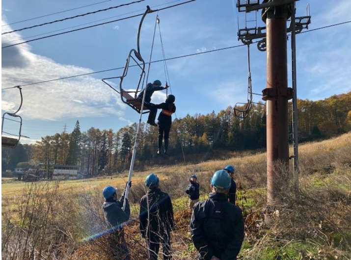
索道スタッフによる救助訓練

また、シーズン中においても定期的なミーティングを行うとともに、トラブルやヒヤリ・ハット事例を常時収集・共有し対策を講じています。また、他スキー場も含めた事故・トラブル事例も速やかに共有し注意喚起と安全向上に努めています。