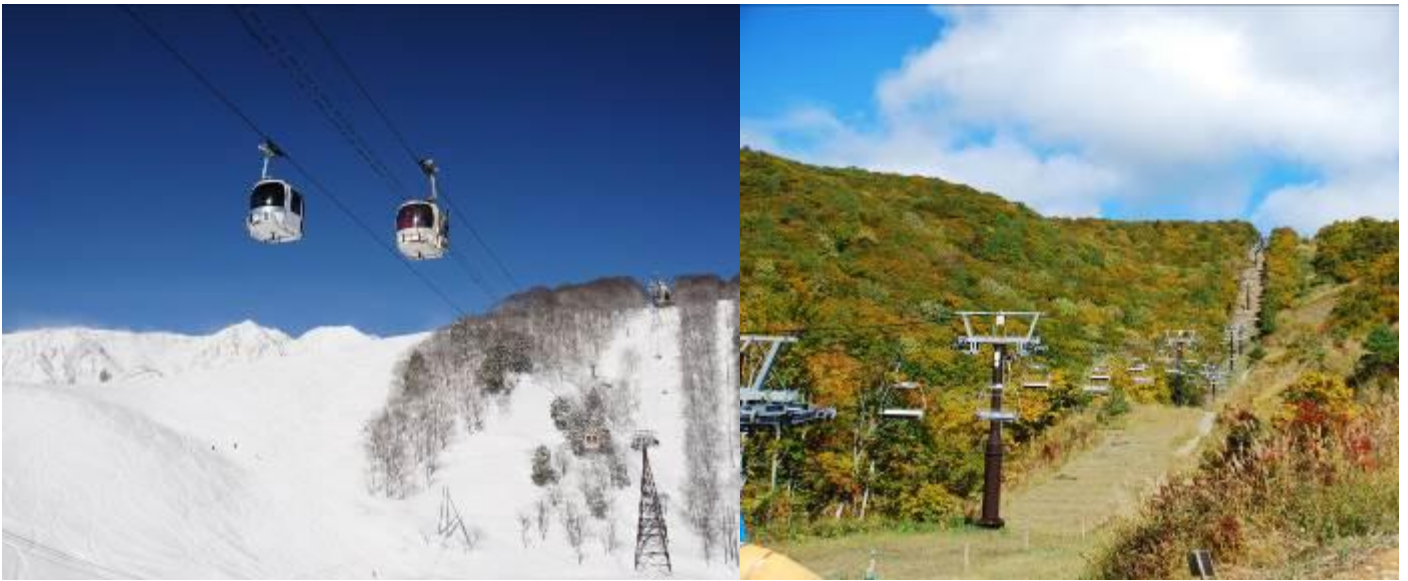
（左写真）岩岳ゴンドラリフト「ノア」、（右写真）5線サウスリフト