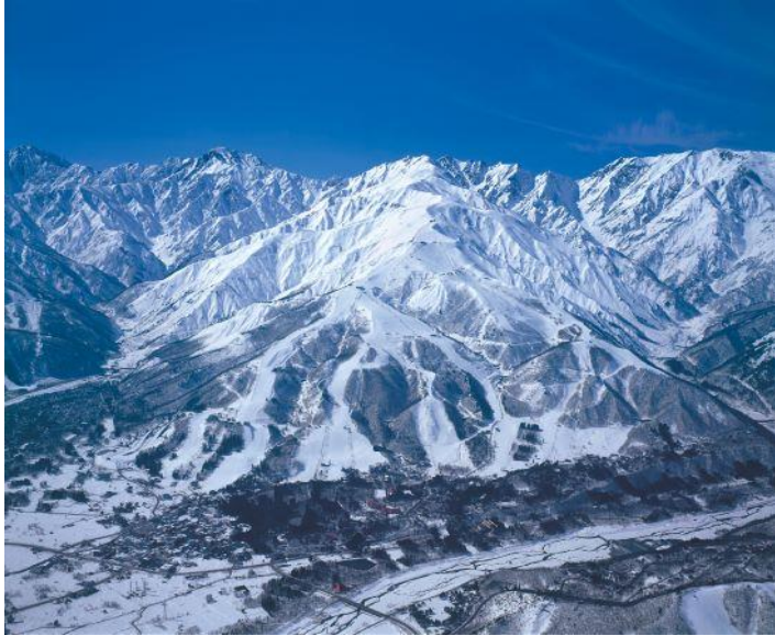
「白馬八方尾根スキー場」