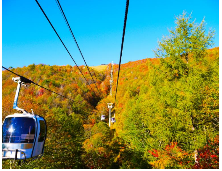
「秋期 ゴンドラリフト」