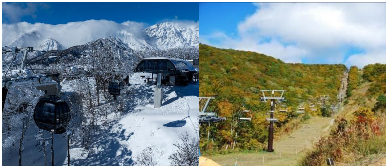
（左写真）岩岳ゴンドラリフト、（右写真）5 線サウスリフト