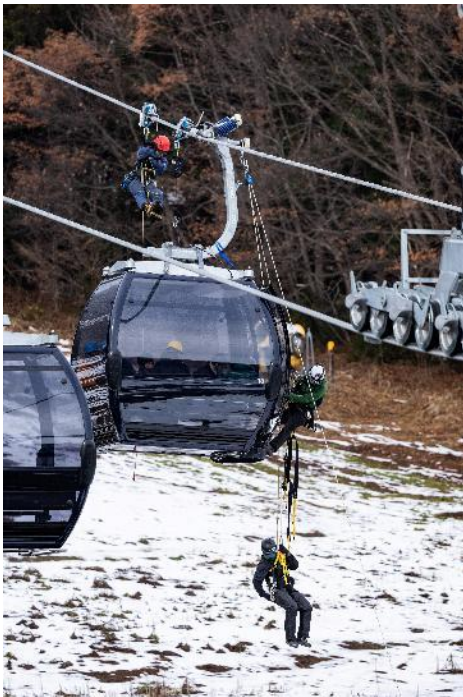
索道スタッフによる救助訓練

また、シーズン中においても定期的なミーティングを行うとともに、トラブルやヒヤリ・ハット事例を常時収集・共有し対策を講じています。また、他スキー場も含めた事故・トラブル事例も速やかに共有し注意喚起と安全向上に努めています。