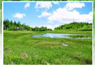
静寂に包まれた池に小さな浮島と 高山植物のお花畑 『浮島湿原』