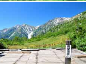
間近にせまる白馬大雪渓と 北アルプスの眺望 『展望湿原』